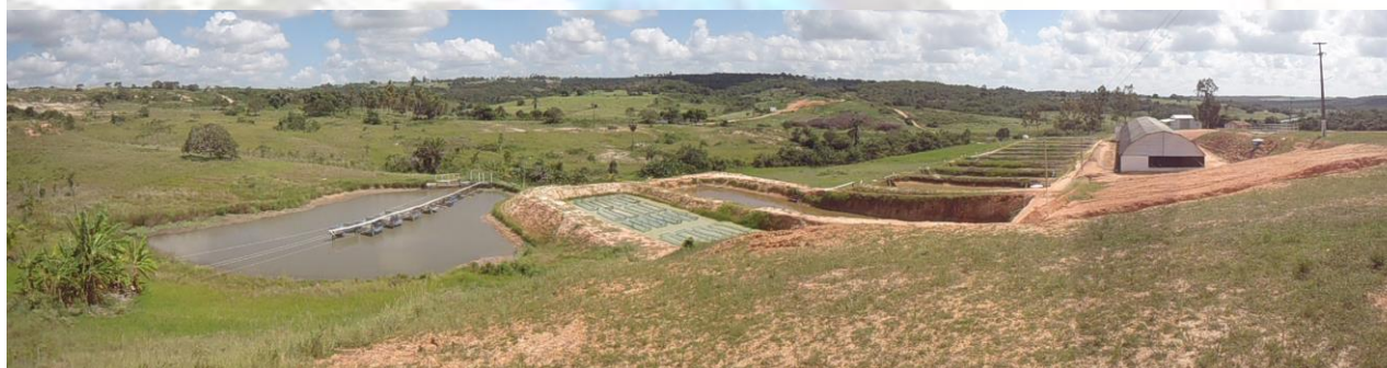
Vista panorâmica da Fazenda