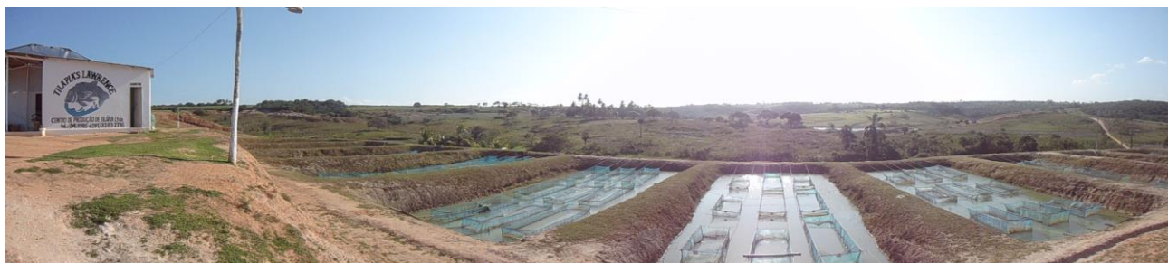
Tanques de alevinagem