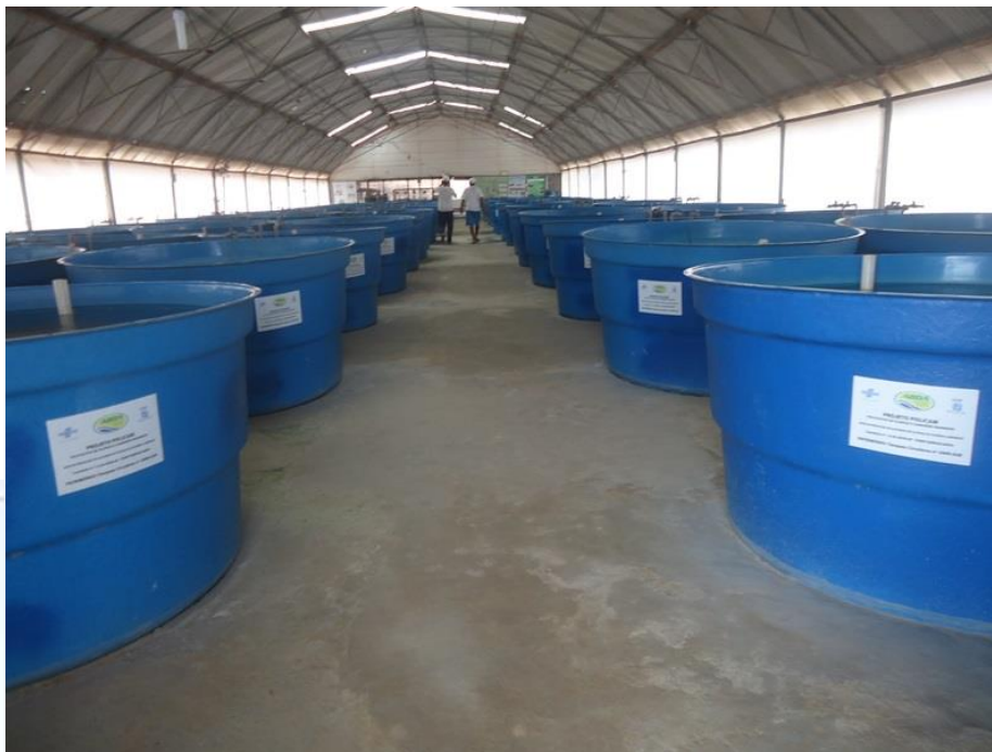
Tanques de Maturação